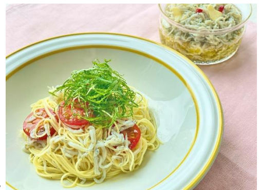
しらすのオリーブオイル漬け 冷製パスタ

食材をオリーブオイルに漬けるだけの、究極の省手間料理が「オリーブオイル漬け」。漬ける食材の脂溶性ビタミンが効率よく吸収できるようになることに加えて、日持ちも良くなり、オリーブオイル漬けをいろいろな料理にトッピングするだけで、料理のバラエティが広がる。